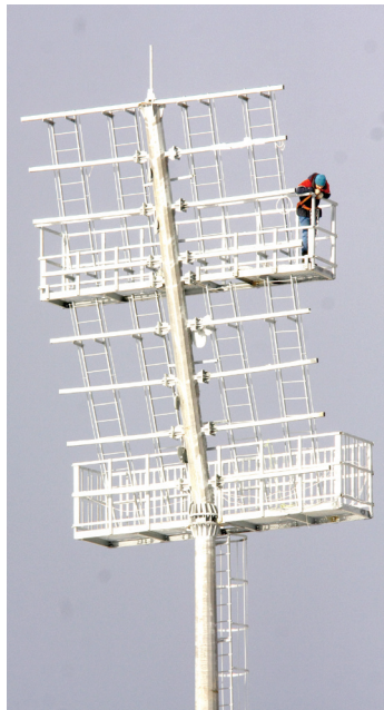
Установка прожекторов на мачты идет на высоте птичьего полета.