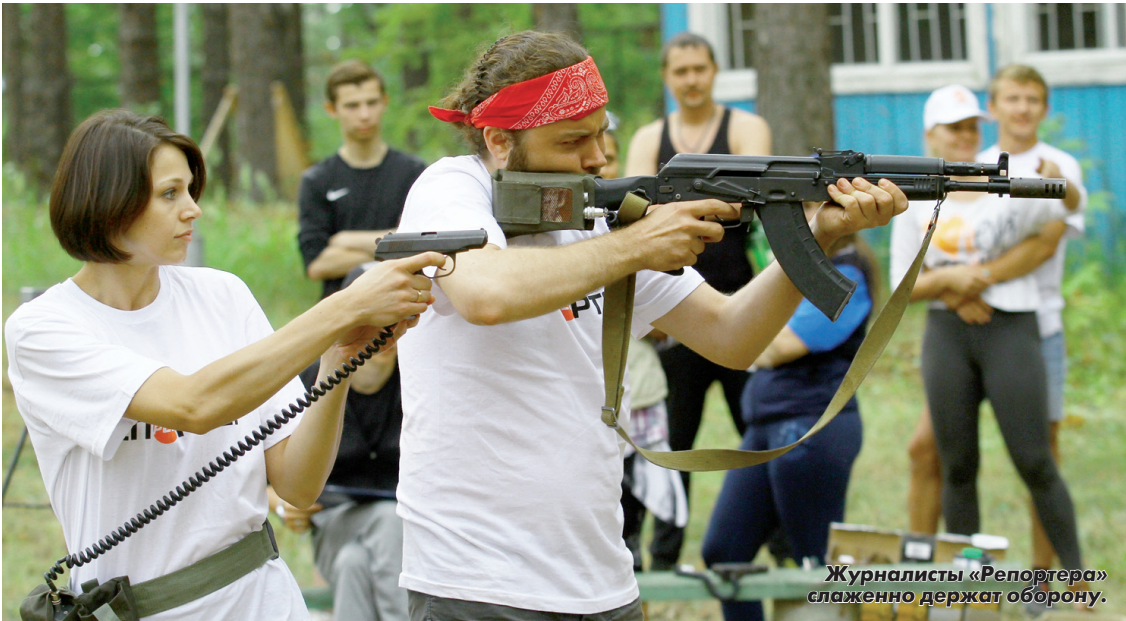
Журналисты «Репортера» слаженно держат оборону.