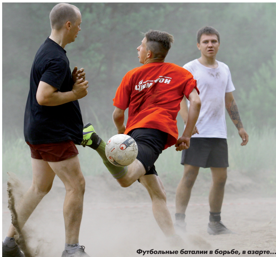
Футбольные баталии в борьбе, в азарте...