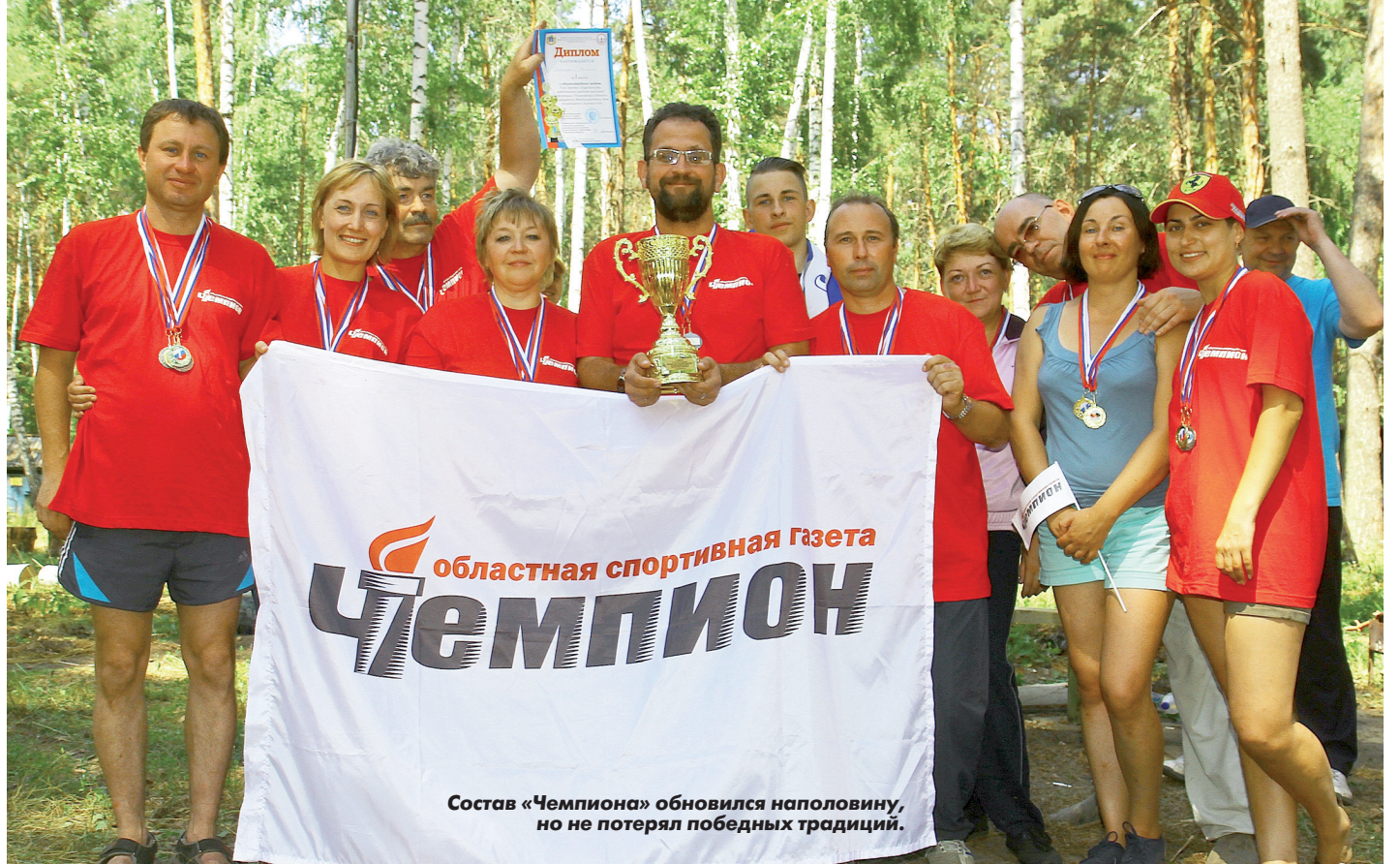
Состав «Чемпиона» обновился наполовину, но не потерял победных традиций.

- Самые незабываемые впечатления от гонок на байдарках: ветер, волны! Дух захватывало! Понравилось также, что в программе Спартакиады новые виды появились. Особенно рад за веревочный курс. Пройдя его, наша команда, в которой по сравнению с прошлым годом было три новичка, еще больше сплотилась. И вместе с тем нам не понятно, почему из программы убрали классическую стрельбу. В нашей команде все единодушны: лазертаг - не самая лучшая замена винтовке, которую мы все держали в руках, когда ходили в тир. Из-за того, что мы провалились в этом виде, не смогли бороться за чемпионство с «Чемпионом». Хотя бронзовые награды для команды - очень хорошо.